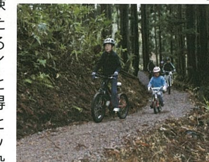
ポタリングコース (イメージ)

初心者から経験者を対象にしたバラエティあるマウンテンバイクの3コースと乗車技術の習得や向上を目的としたスキルアップエリアを併設