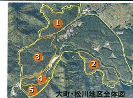
大町・松川地区全体図

マウンテンバイクや水辺での川遊び、多様なプログラムなど通じて自然を楽しむ機会を提供