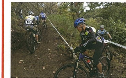
トレイル練習コース (イメージ)