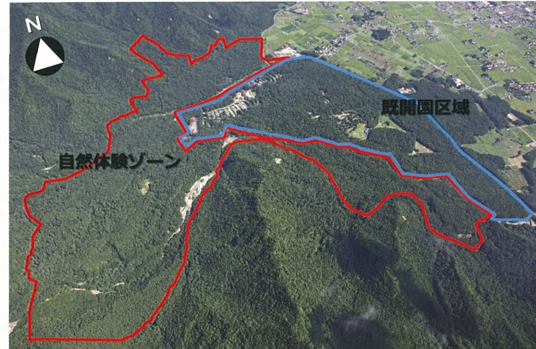
大町・松川地区全景写真