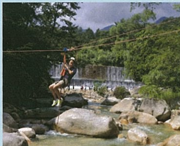
ツリーイングでの渡河体験