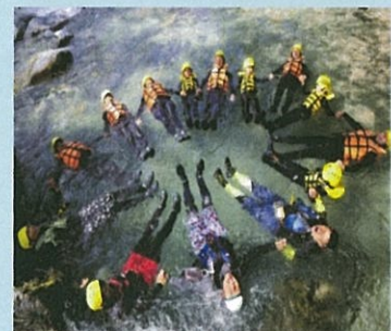
シャワーピクニック