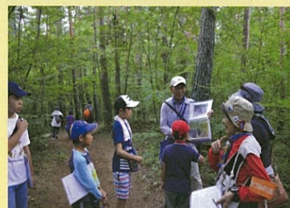
自然観察会開催 (イメージ)

春のツツジ・新緑、秋の紅葉等の自然観察やウォーキングにより乳川河畔を探勝できるエリア