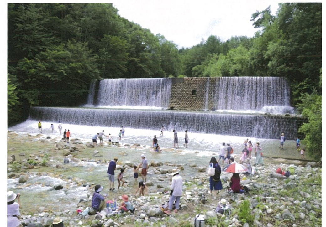
川遊びイベント(スプラッシュリバー)