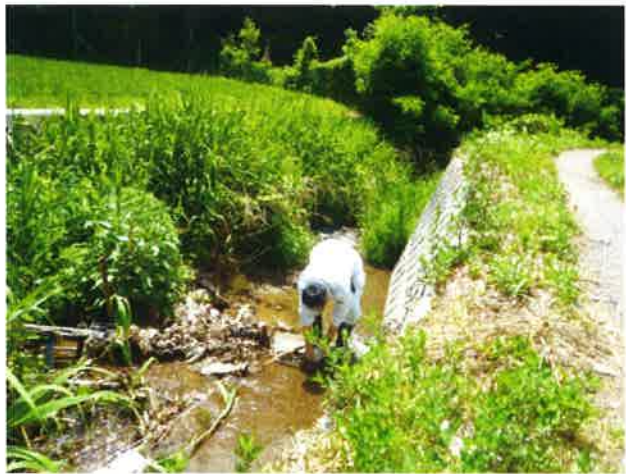
河川採水 6月24日 10:35