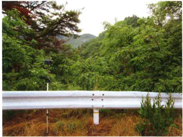
調査地点No.2 国道待避所 散布中捕集 6月22日 5:12