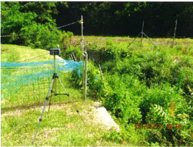
調査地点No.1 田畑付近 散布中捕集 7月21日 8:54