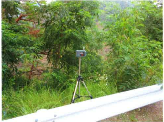
調査地点No.2 国道待避所 散布中捕集 7月21日 4:52