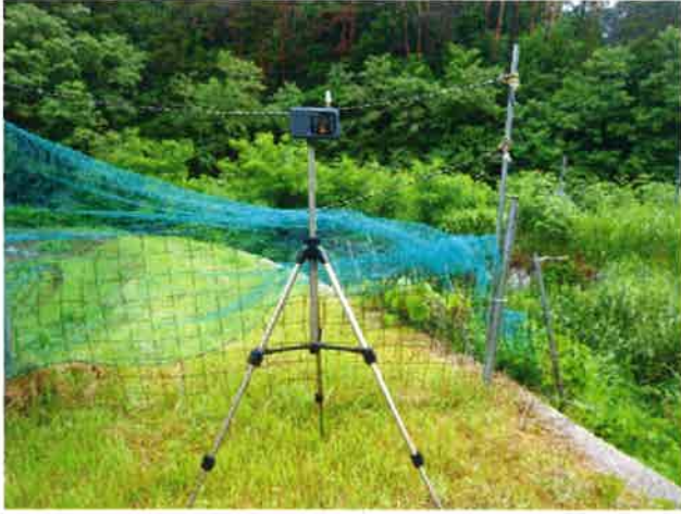
調査地点No.1 田畑付近 散布中捕集 6月22日 5:30