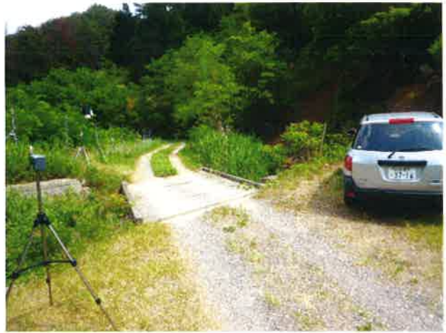
気象データ計測風景