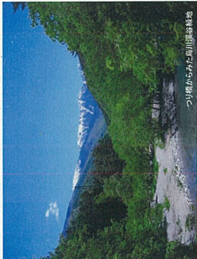
つり橋からみた鳥川溪谷緑地