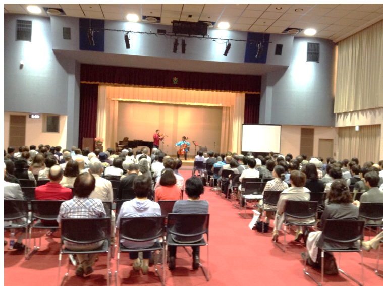
平成30年5月27日に開催しました