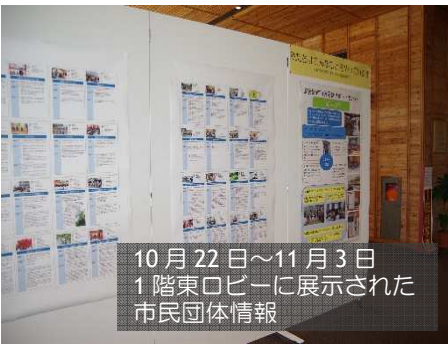
10月22日～11月3日 1階東ロビーに展示された 市民団体情報

市民活動サポートセンターは活動支援、交流事業、相談事業、スキルアップ講座などに取り組んでいます。センターそのものの認知度が低い、利用者が少ないなどの諸事情で十分に機能を発揮できていません。