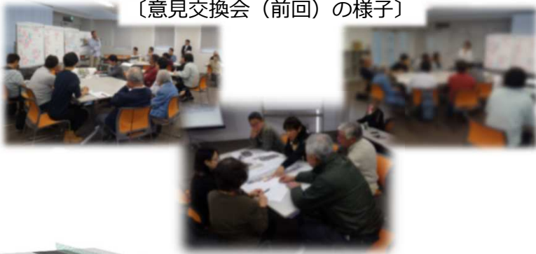
〔意見交換会（前回）の様子〕