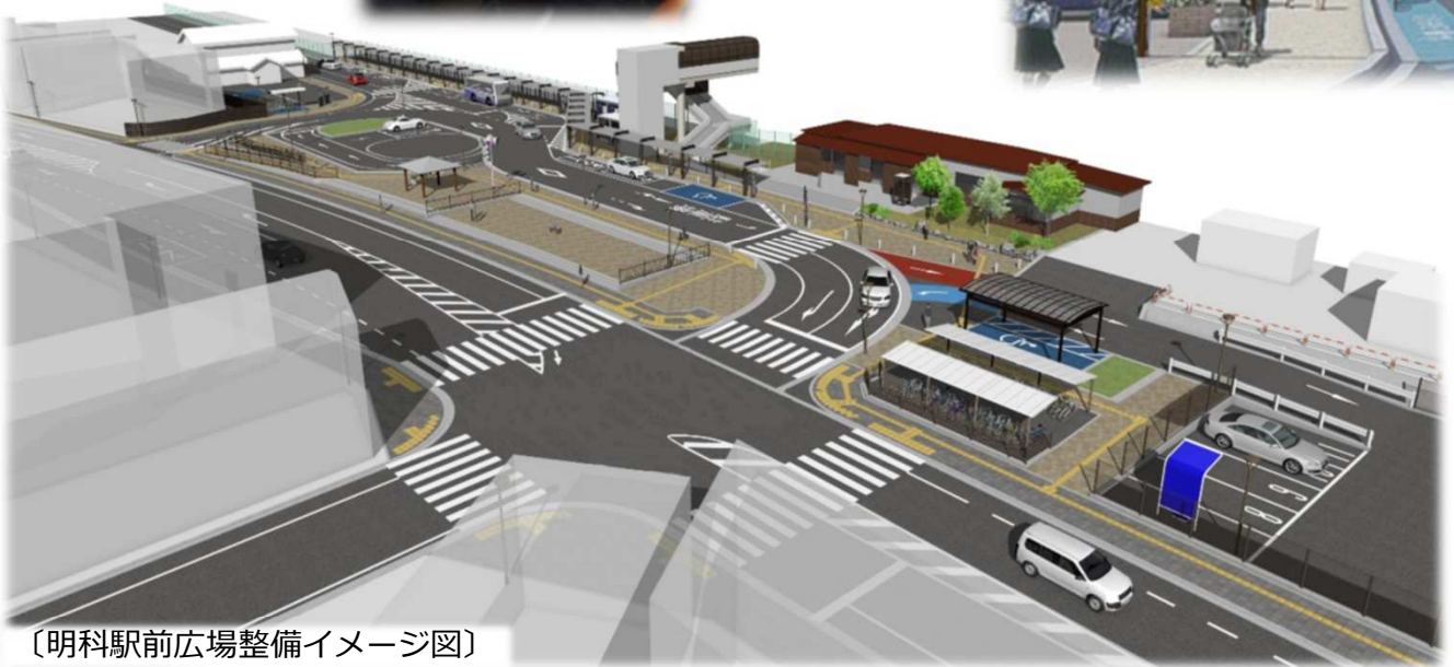
〔明科駅前広場整備イメージ図〕

市では、平成30年度から令和4年度までの5年間の計画で、明科駅周辺のまちづくり事業（明科駅周辺都市再生整備計画）を進めています。