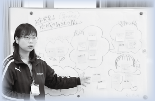
穂高地域生活支援コーディネーター (市社会福祉協議会穂高支所)