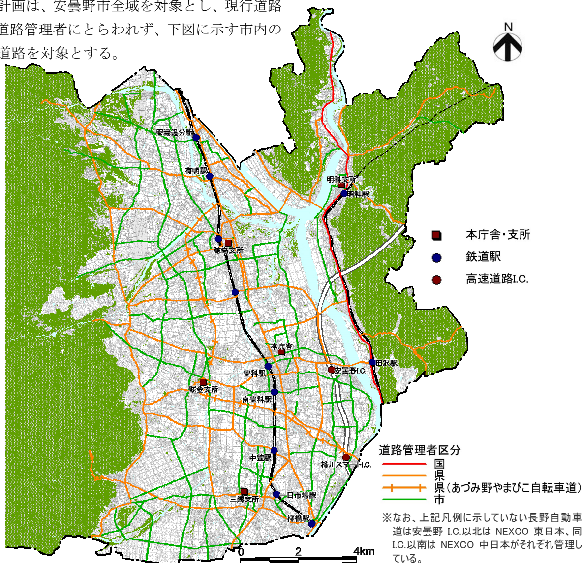
図 1-1 計画対象範囲

本計画は、安曇野市全域を対象とし、現行道路は、道路管理者にとらわれず、下図に示す市内の幹線道路を対象とする。