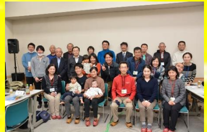
市議会議員・区長・参加者の皆さん

三郷地域にはH30～R3で120人の移住者がいます。「転入者が来るということは三郷小倉に魅力がある！小倉の魅力を多くの人にPRできれば移住者が増え人口が増える！」という思いから、小倉地域の区長と地元の市議会議員に声をかけて、移住の推進を図るために、移住者の受け入れ体制づくりと移住体験ツアーの実現に取り組みました。