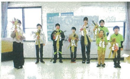
「年末の交通安全運動」で、少年部による交通安全を祈願した「正月飾り作成研修会」を開催した。(安曇野)