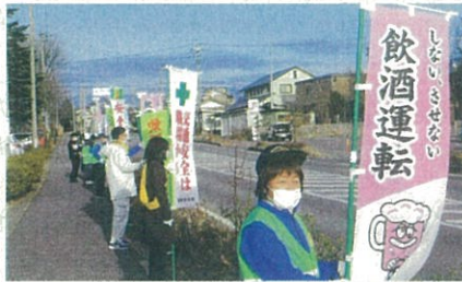
「年末の交通安全運動」で、御代田町内の県道において飲酒運転防止などを呼び掛けた。(佐久)