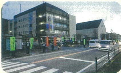
「年末の交通安全運動」で、諏訪警察署前において街頭啓発活動を実施した。(諏訪)