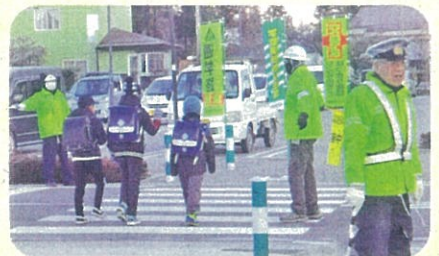
「年末の交通安全運動」で、通学路において児童に対する見守り活動を実施した。(池田松川)