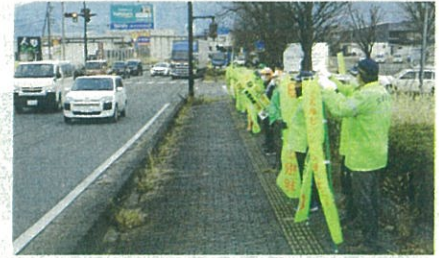
「年末の交通安全運動」の活動で、松代大橋前県道において街頭啓発活動を実施した。(長野南・松代)