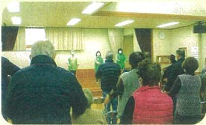
管内の公民館において高齢者に対する交通安全教室を開催した。(小諸)