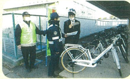
「年末の交通安全運動」の活動で、管内の高校において自転車ヘルメットの着用啓発を実施した。(須高)