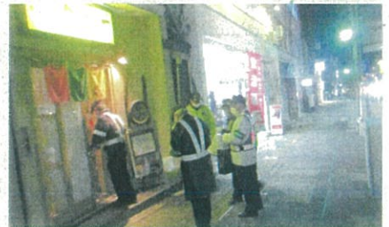
「年末の交通安全運動」で、飲食店を対象とした「飲酒運転防止パトロール」を実施した。(飯伊)