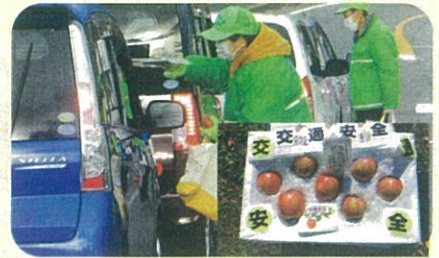
「年末の交通安全運動」で、ドライバーに「交通安全文字入りりんご」を手渡して交通事故防止を指導した。(川西)