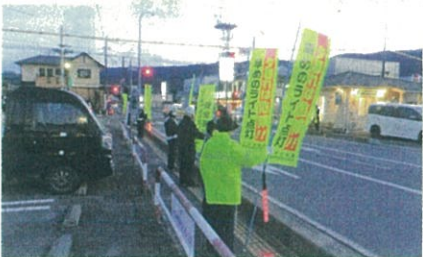
「年末の交通安全運動」で、市役所西県道交差点において街頭啓発活動を実施した。(茅野)