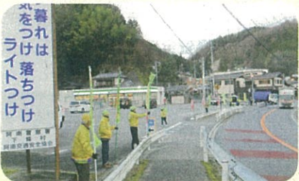
「年末の交通安全運動」で、管内の国道において街頭啓発活動を実施した。(阿南)