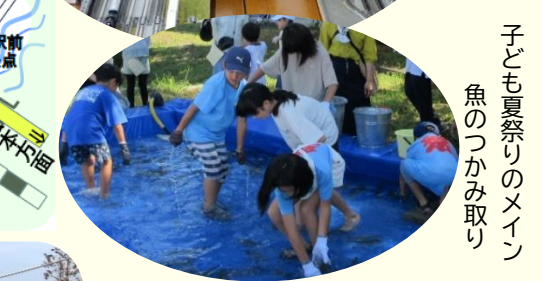
子ども夏祭りのメイン 魚のつかみ取り