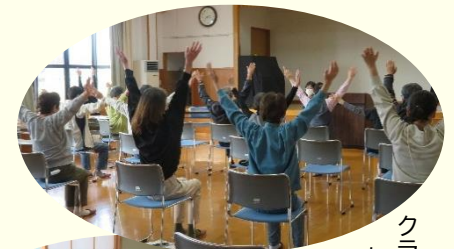
クラブや同好会は あれこれ・色々・様々