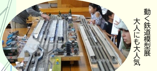
動く鉄道模型展 大人にも大人気