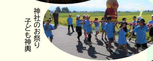
子ども神輿 神社のお祭り