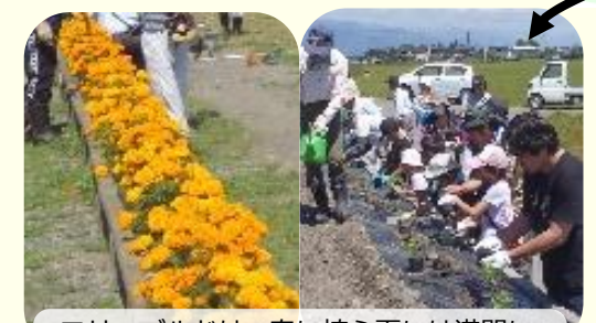
マリーゴールドは、春に植え夏には満開に