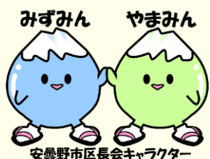
安曇野市区長会キャラクター

災害伝言ダイヤル 171 ※ダイヤルは、ガイダンスに従って、 録音・再生を行ってください。 ※録音時間 30秒