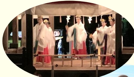
浦なお祭り 神社のお祭り