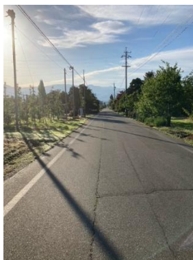
朝日を浴びる区内の通り