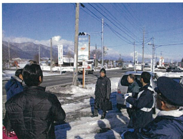
通し番号 11 (1) 安曇野市三郷（楡） 中堀一日市場（停）線