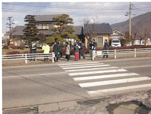
通し番号 3 光橋東側の交差点