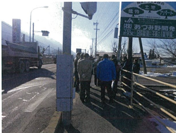
通し番号 14 天神原団地入口交差点