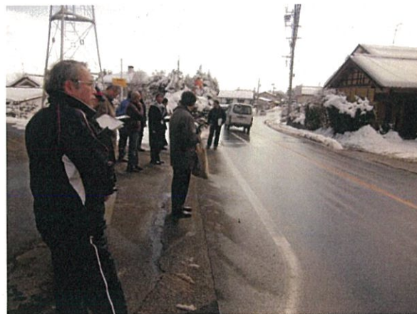
通し番号 9 安曇野市穂高（牧）第 12 分団第 1 部詰所前