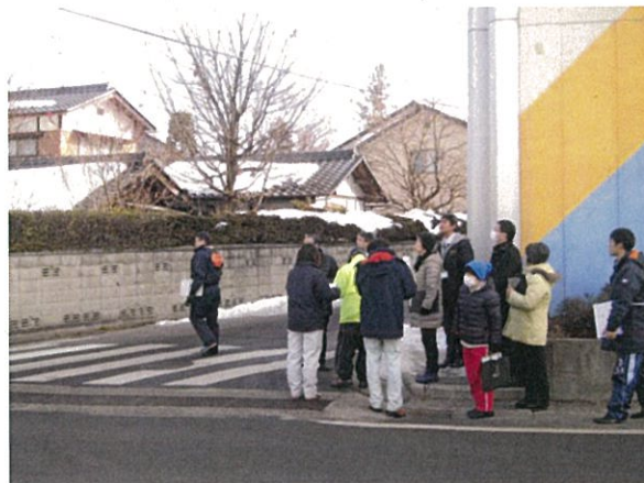
通し番号 2 新田中交差点