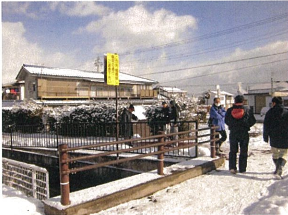
通し番号 4 南小学校入口交差点西側の歩道と矢原 堰沿い道路との交差点