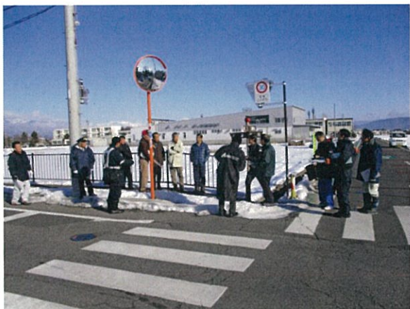
通し番号 10 小学校南側の小倉梓橋（停）線と市道との交差点

実施地域：三郷（三郷小学校区） 実施日：平成 28 年 2 月 3 日（水） 点検箇所