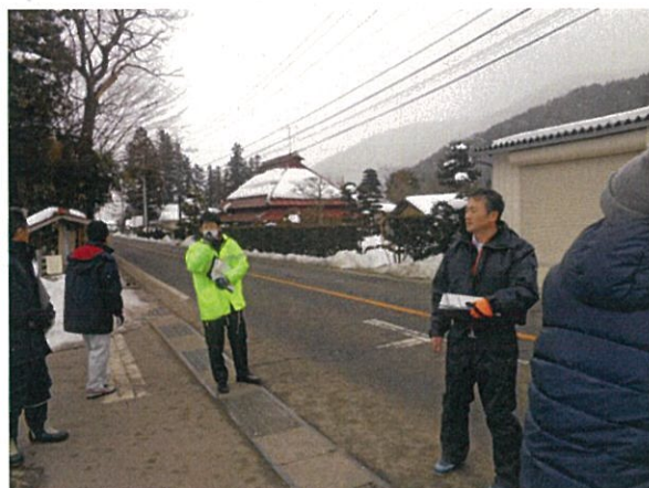
通し番号 13 安曇野市堀金（岩原） 塩尻鍋割穂高線