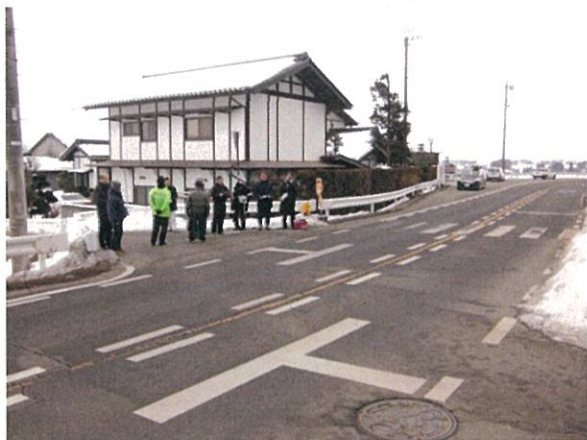
通し番号 12 安曇野市堀金三田 1775 付近 （塩尻鍋割穂高線）交差点

実施地域：堀金（堀金小学校区） 実施日：平成 28 年 2 月 9 日（火） 点検箇所