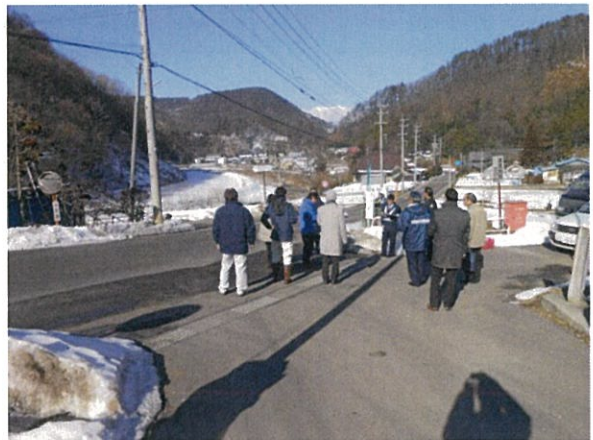
通し番号 15 安曇野市明科（大足）矢室明科線