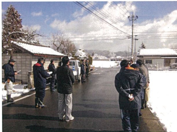
通し番号 7 安曇野市穂高北穂高 2452-5 付近交差点