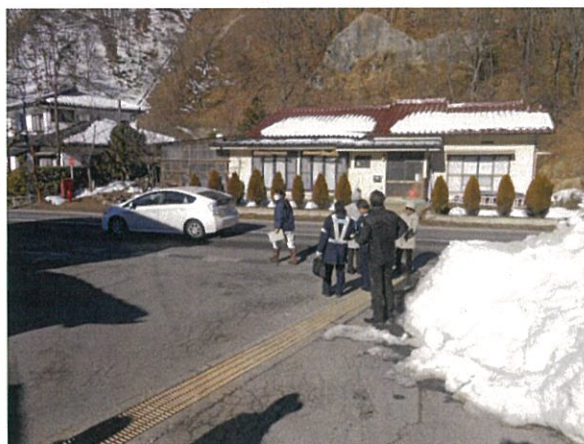
通し番号 16-1 安曇野市明科（松庄入口）