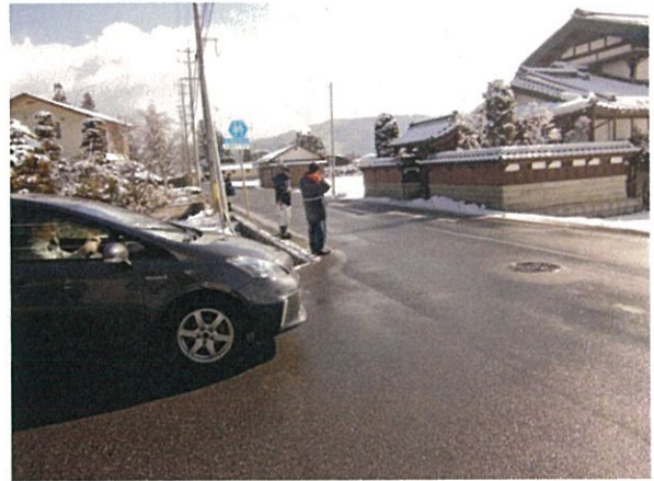
通し番号 8 安曇野市穂高（狐島）穂高明科線