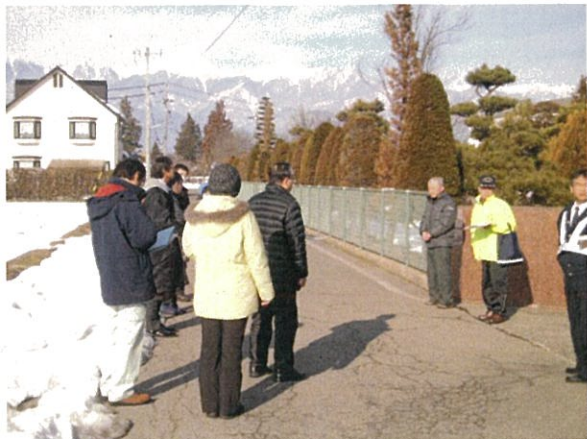
通し番号 1 豊科南中外周道路