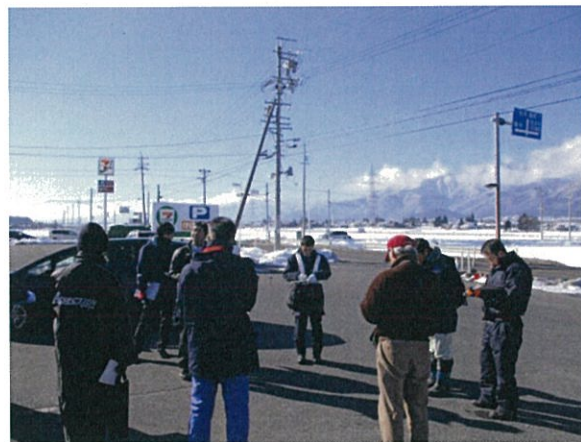
通し番号 11 (2) 安曇野市三郷（住吉） 中堀一日市場（停）線