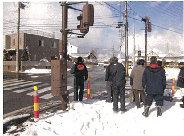
通し番号 6 安曇野市穂高 小岩岳穂高（停）線