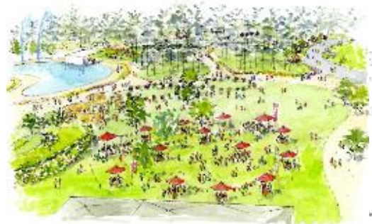
ハレの広場 イメージ