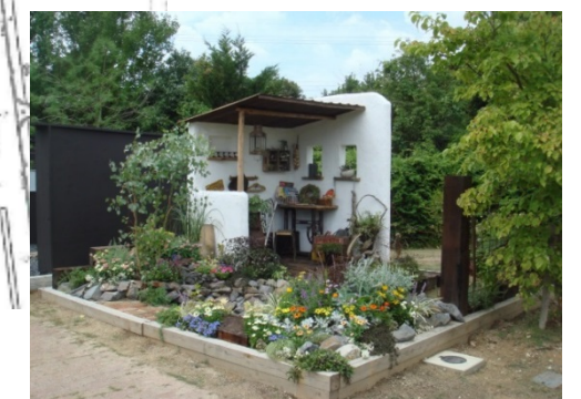
庭園出展のイメージ (先催フェア)

企業・団体等からの庭園出展 (信州の原風景を模した庭、現代的なガーデン等の庭園)