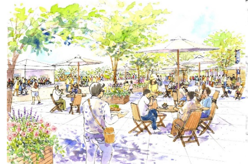
信州マルシェ イメージ