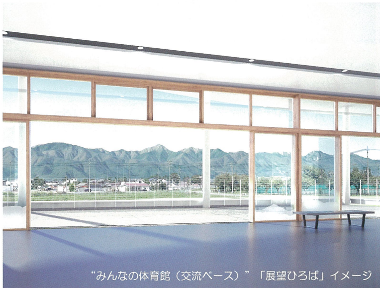
“みんなの体育館（交流ベース）” 「展望ひろば」イメージ