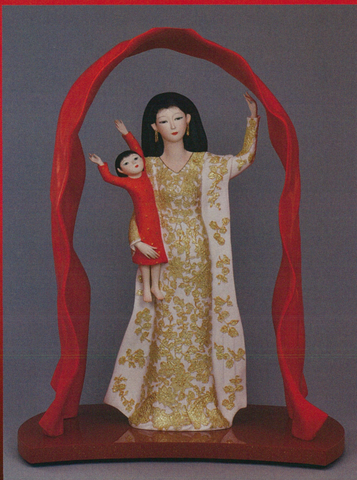
令和に明けゆく【人形】 奥田小由女（日展理事長）