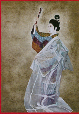
古道成寺 福田千恵(日展理事・審査員)