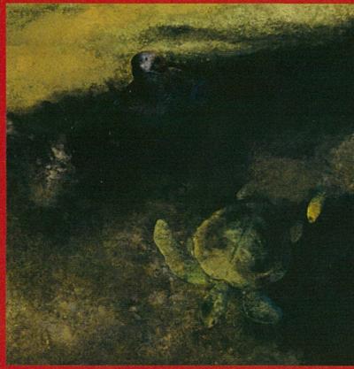
海の哲人 土屋禮一(日展副理事長)