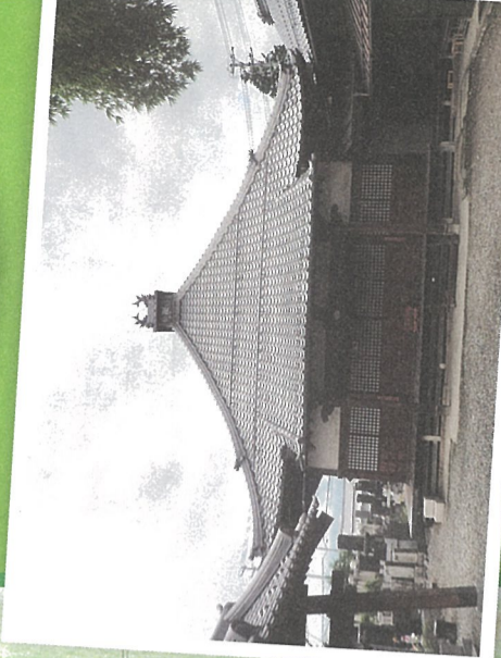
D 見石山歡喜寺 腰屋根の装飾に注目