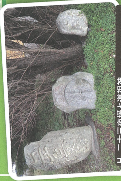
H 二十三夜塔と道祖神 [中] 祝言像、明治14年(1881) [右] 握手像、建立年不明