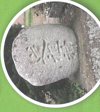
A 道祖神 天保12年(1841)