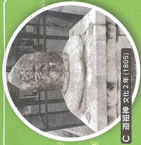
C 道祖神 文化2年(1805)