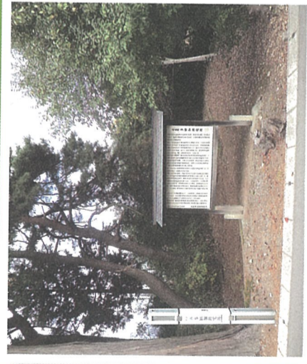
県史跡多田加助宅跡