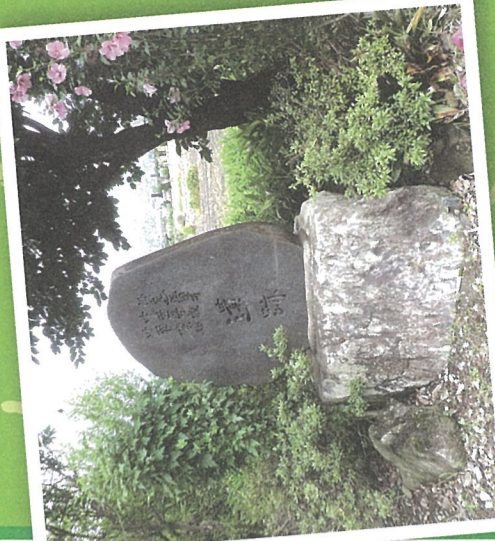
E 中萱学校跡 明治期の学び舎