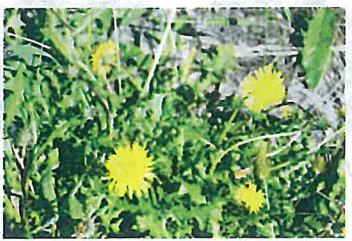
セイヨウタンポポ (キク科)