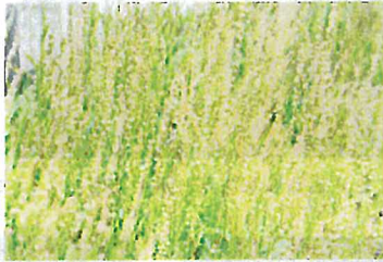
ヒメスイバ (タデ科)