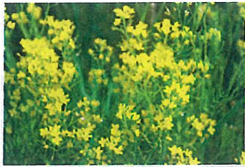
ハルザキヤマガラシ (アブラナ科)