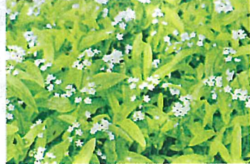
ワスレナグサ (ムラサキ科)