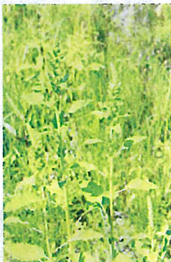
ホソアオゲイトウ (ヒユ科)