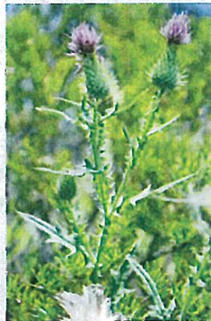
アメリカオニオザミ (キク科)