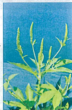
オオブクサ (キク科)