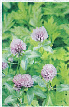
アカツメクサ (マメ科)