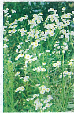
ヒメジョオン (キク科)