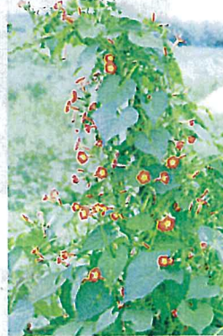
マルバルコウ (ヒルガオ科)