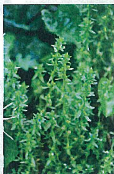
タチヌノフグリ (ゴマノハグサ科)