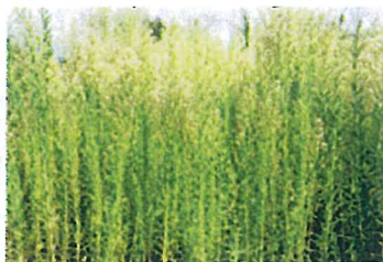
ヒメムカシヨモギ (キク科)