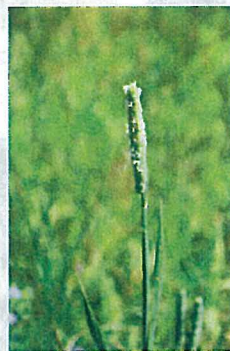
オオアワガエリ (イネ科)