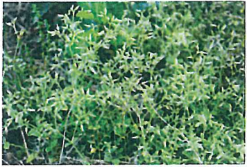
オランダミミナグサ (ナデシコ科)