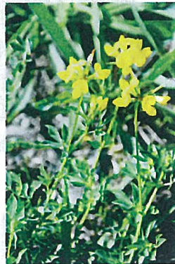
セイヨウミヤコグサ (マメ科)