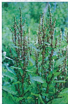
アレチギシギシ (タデ科)