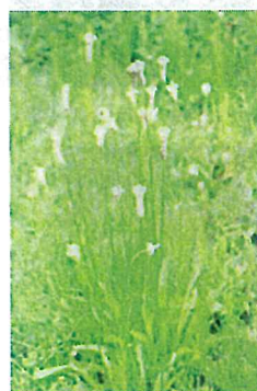
ヘラオオバコ (オオバコ科)