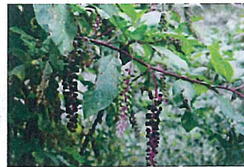
ヨウシュヤマゴボウ (ヤマゴボウ科)