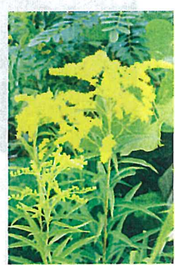
オオアワダチソウ (キク科)