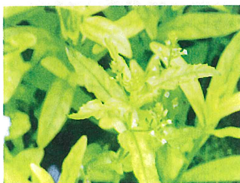
カワヂシャ (在来種)