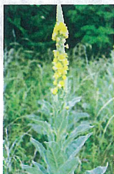
ビロードモウズイカ (ゴマノハグサ科)

帰化植物—自然の営力にたよらず、人為的営力によって、意識的または無意識的に移入された外来植物が野生の状態で見いだされるものをいう。