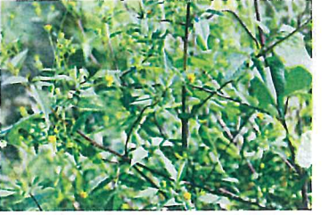
アメリカセンダングサ (キク科)