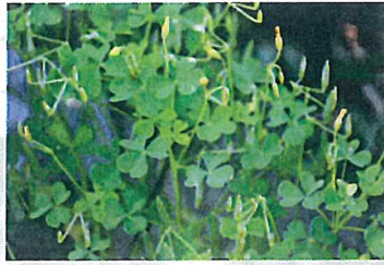
オッタチカタバミ (カタバミ科)