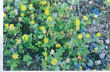
コメツブツメクサ (マメ科)