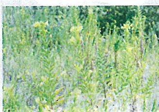
メマツヨイグサ (アカバナ科)