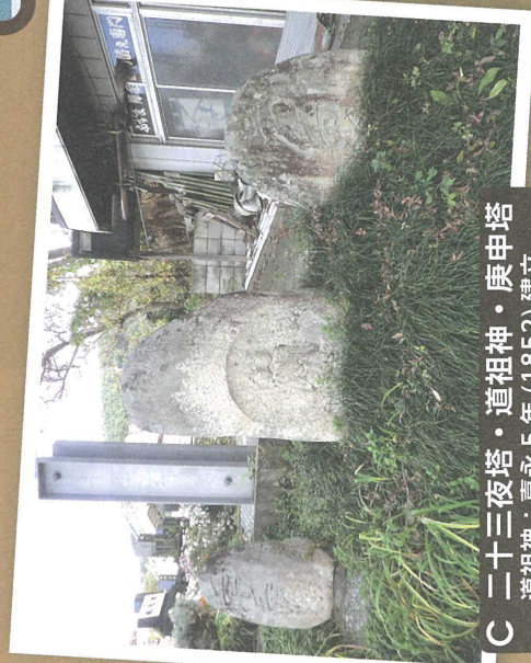
C 二十三夜塔・道祖神・庚申塔 道祖神：嘉永5年(1852)建立