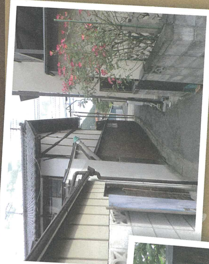
B まちなかの裏路地