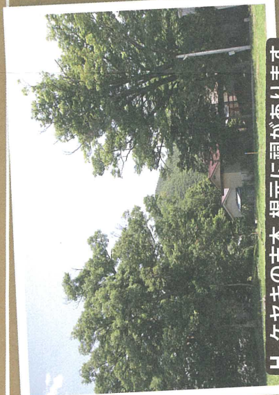
H ケヤキの古木 根元に祠があります