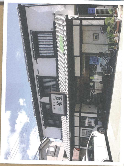
E 笹屋 明治35年創業の老舗菓子店