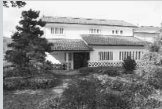
臼井吉見文学館 (堀金総合支所南側)

臼井吉見文学館は、指定管理者制度を利用し、9月から安曇野地域住民ネットワークが運営しています。今後、文学館の運営の充実を図るために「友の会」を立ち上げます。そこで運営を支えていただける友の会会員を次のとおり募集します。