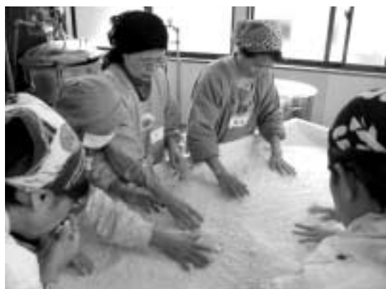
麹(こうじ)の種つけ作業の様子

講師 豊科女性研修センター利用 運営委員 材料費 味噌10kg当たり2,500円 ※最終日に徴収します。 持ち物 三角巾・エプロン その他 作業ができる服装でご参加ください。 昼食は各自でご用意ください。 申込期間 3月15日(木)〜27日(火) 申込方法 電話で豊科総合支所地域支援課まちづくり推進係までお申し込みください。定員になり次第締め切ります。