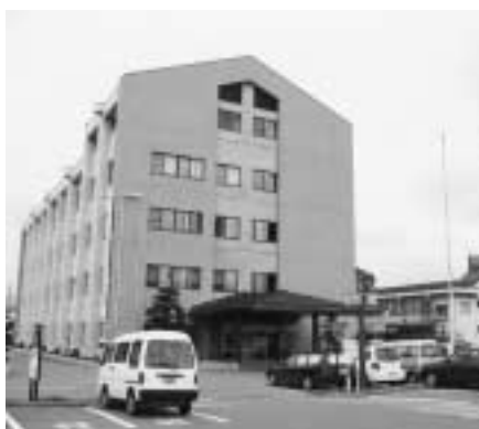
4月から県安曇野庁舎1階の 税務窓口業務が終了になります

県からお知らせ 松本地方事務所安曇野連絡所 税務業務の終了について 現在、松本地方事務所安曇野連絡所（安曇野市豊科4960-1長野県安曇野庁舎内）で取り扱っていた県税の納税および納税証明書の発行に関する業務は、同連絡所の廃止に伴い、平成19年3月末で終了することになりました。 日ごろからご利用いただいた皆様には大変ご不便をお掛けすることになります。ご理解をお願いいたします。 なお、4月1日以降は、県税の納税は最寄りの金融機関または地方事務所税務課をご利用ください。また、納税証明書の発行は、地方事務所税務課をご利用ください。（郵送でも受け付けています）