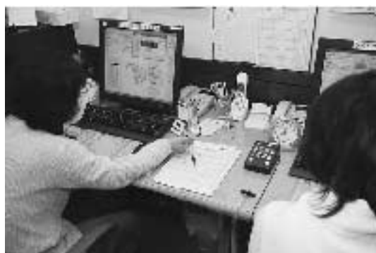
市社協本所に受付センターを設置