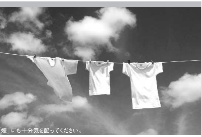
「煙」にも十分気を配ってください。

廃棄物の野外焼却、いわゆる「野焼き」は、一部の例外を除き法律で禁じられています。この例外を中心に、「野焼き」のよくある質問をまとめました。 Q 農業で行う「あぜ草焼」や「もみ殻の焼却」はできるの? A できます。農業を営むため病害虫の駆除ができる「あぜ草焼き」など、農業を営むためにやむを得ない焼却は、例外として認められています。ただし、煙などで近隣へ迷惑が掛からない