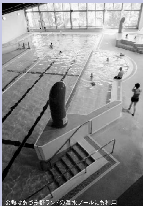
余熱はあづみ野ランドの温水プールにも利用

生ごみ以外のもえるごみは、実験が進んでも、残念ながらリサイクルすることはできないのが現状です。混ぜればごみ、分ければ資源。ごみの分別を徹底し、もえるごみの減量にご協力ください。