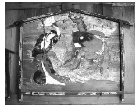
熊野神社(三郷)「山姥と金太郎」