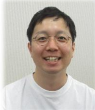
三郷地域 中越コーディネーター