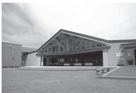
水辺の楽校に隣接する自然体験交流センター「せせらぎ」

遊水池にはハクチョウが飛来するほか、マレットゴルフ場や休憩などで利用できる自然体験交流センター「せせらぎ」がある。