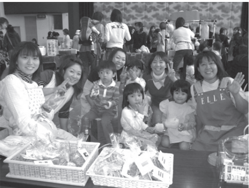
昨年のひまわりクラブバザーの様子