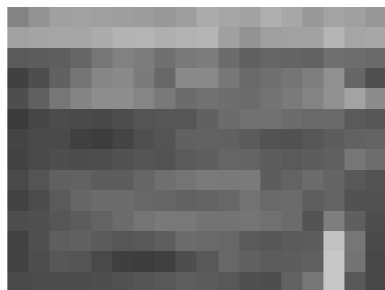
モデル分譲地・野花見分譲