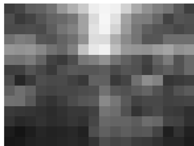
全国菜の花サミット・全体会