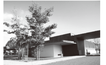
安曇野高橋節郎記念美術館