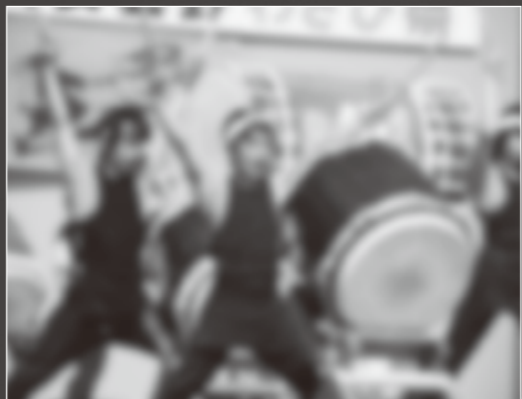
信州安曇野わさび祭り