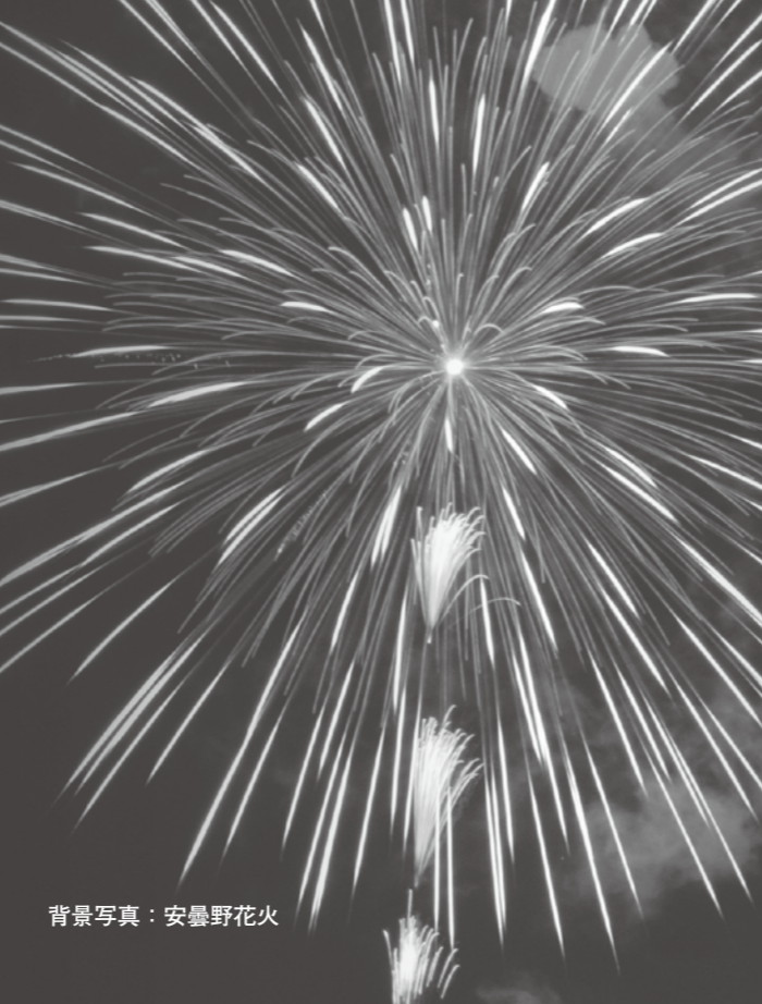
背景写真：安曇野花火