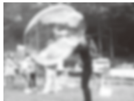
巨大なシャボン玉をつくろう

スポーツの上達につながる「動きのもと」を自然と身につける工夫や、ちよつとしたチャレンジを取り入れた「運動遊び」を学びます。親子で楽しく「運動偏差値」をアップしてみましよう。