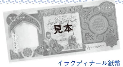
イラクディナール紙幣