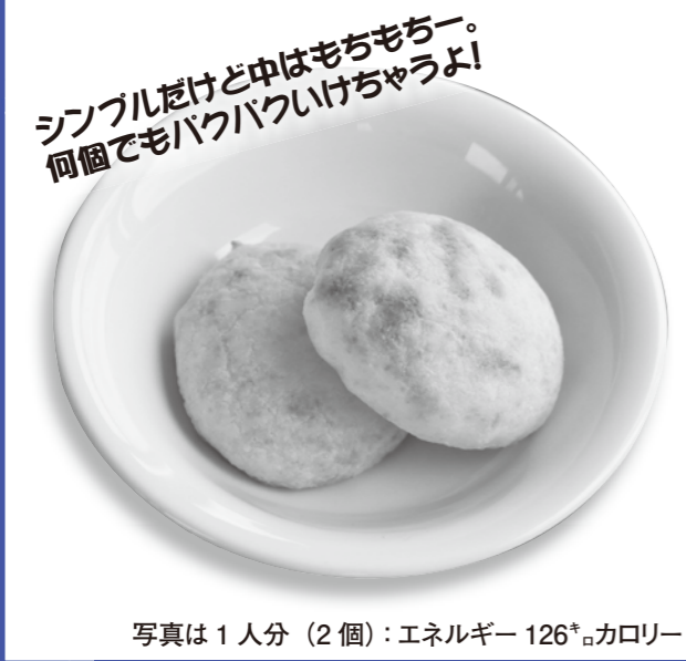
写真は1人分(2個):エネルギー 126kcal

市食生活改善推進協議会の料理教室で教えていただいたおすすめレシピをご紹介します。