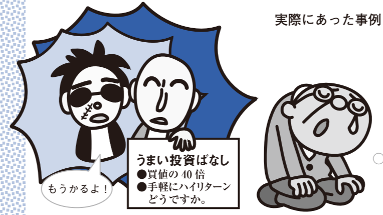
実際にあった事例

高齢者や過去に未公開株などの投資トラブルにあった消費者をねらって、業者が「イラクの通貨『ディナール』を今買えば、将来、円に両替したときに儲かる」と電話やダイレクトメールなどの方法で勧誘する投資トラブルが全国で急増しています。