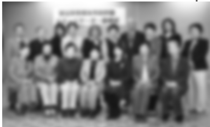
委嘱された男女共同参画コミュニケーターの皆さん