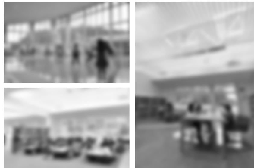
図書室(写真右) 遊戯室(写真左上) 児童クラブ室(写真左下)

お父さん、お母さんも通った旧堀金保育園が、待望の児童館として生まれ変わりました。