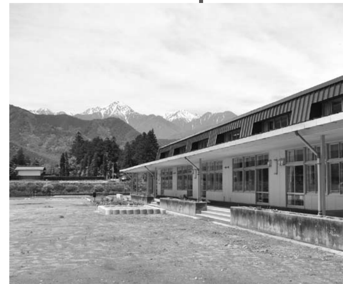
新しく生まれ変わった堀金児童館

子どもたちが伸び伸びと育つよう願っています。また、自然豊かな堀金地域の特色を活かし、地域のきずなを大切にしたい児童館となるよう期待しています」とあいさつしました。