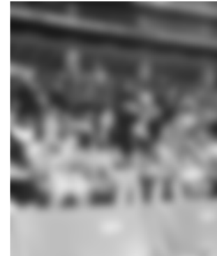
ヤフードームで野球観戦（H21）

● 応募条件 市内に居住する小学5年生から中学2年生で、来年度の交流事業（安曇野市で開催）に必ず参加できること ● 募集人員 10人（男女各5人） ● 参加費用 小学生 1万7000円 中学生 2万8000円