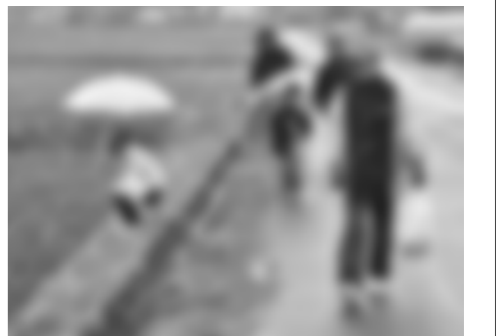
地元区民ら約40人が参加