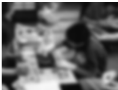
安曇野高橋節郎記念美術館 夏休み漆芸体験

☎ 明科総合支所内文化課 (TEL) 62・3090 (FAX) 62・3525