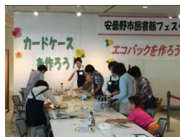
(ワークショップの様子)

2日間を通じて「おはなし会」、カードケース・エコバックづくりなどの「ワークショップ」や方言カルタ大会、毎年人気の図書リサイクルコーナー、松本山雅FC連携事業として選手の写真や推薦図書を紹介、山雅FC後援会安曇野支部の活動を紹介する展示なども行い、多くの方で賑わいました。