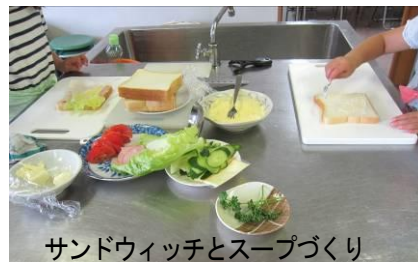
サンドウィッチとスープづくり

次回は、9月初旬に乳幼児を対象に「体を使って遊んでみよう」と題して、親子でスキンシップをしながら運動します。講師は、「おはなしつむぎい」とのみなさんです。たくさんの方の来館をお待ちしています。