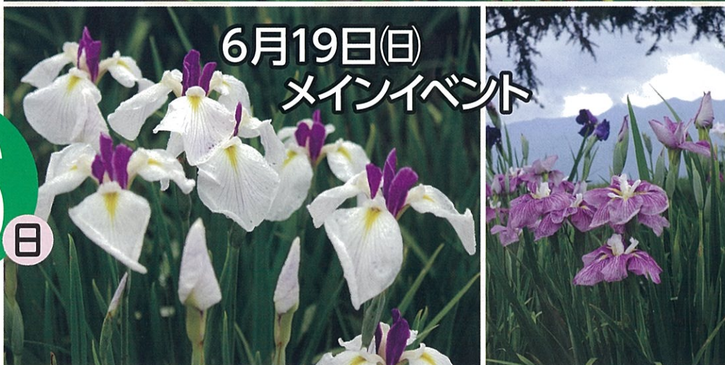
2015 あやめまつりフォトコンテスト最優秀賞作品 雨の中 あざやかに!