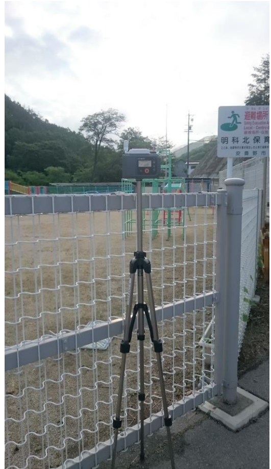
調査地点No.2 明科北保育園(6.20 6:33)