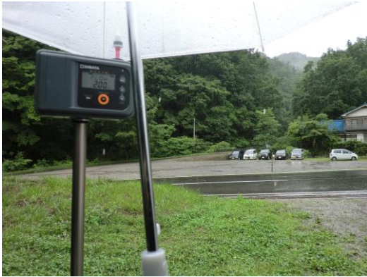
調査地点No.1 民家駐車場(6.19 12:52)