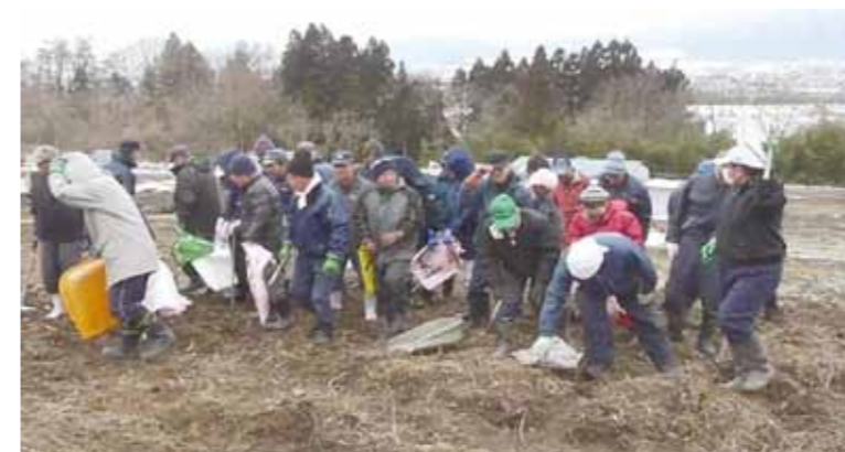
天王原ボランティア作業

遊休農地活用シンポジウムで明科地域の農業を守る会が 「長野県農業会議会長賞」を受賞しました