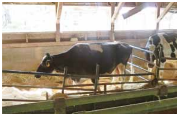
名号 「ジョウネン アパッチ カーネーション」

※名誉原種牛とは 長野県で、昭和38年度に乳用牛の改良を推進するため、独自に定めた認定制度。生産乳量、乳成分、形質などが一定の基準を満たした能力の高い乳用雌牛を原種牛に認定し、更に母牛として、原種牛を2頭以上生産した原種牛を「名誉原種牛」に認定している。 名誉原種牛の認定割合は県内ホルスタインの約0.03%と極めて少数