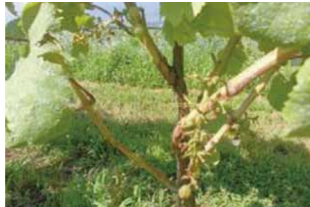
天王原 ブドウの被害