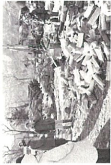
新の生産場所(木質バイオマス利用促進PJ)

計画では皆さんが親しみをもって参加していただけるように、計画に関わるすべての取り組みを愛称として「さとぷろ。」と呼んでいます。また、計画の5つのプロジェクト(以下、P1)を、具体的な取り組みと位置付け、市民・山林所有者、事業者などの皆さんと行政が協働して進めています。本年度の取り組みについてお知らせします。