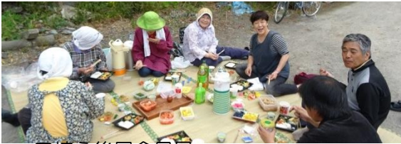
田植え後昼食風景

特に、黒豆と小豆はさろん活動の料理に利用し福祉施設へのお届けもしています。畑で育った野菜も活動利用はもちろんのこと、福祉施設での提供にもつながっています。うるち米は横浜・藤沢の施設に購入していただき法人の活動資金の一助となっています。