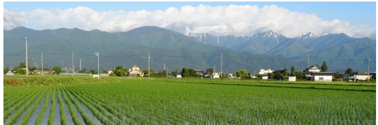
アルプスが水面に〜こしひかり