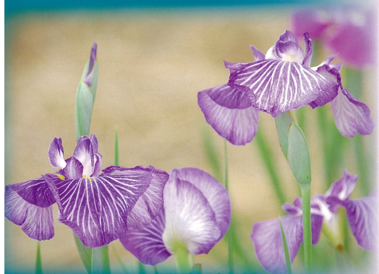
2014 あやめまつりフォトコンテスト最優秀賞作品「気品溢れで」