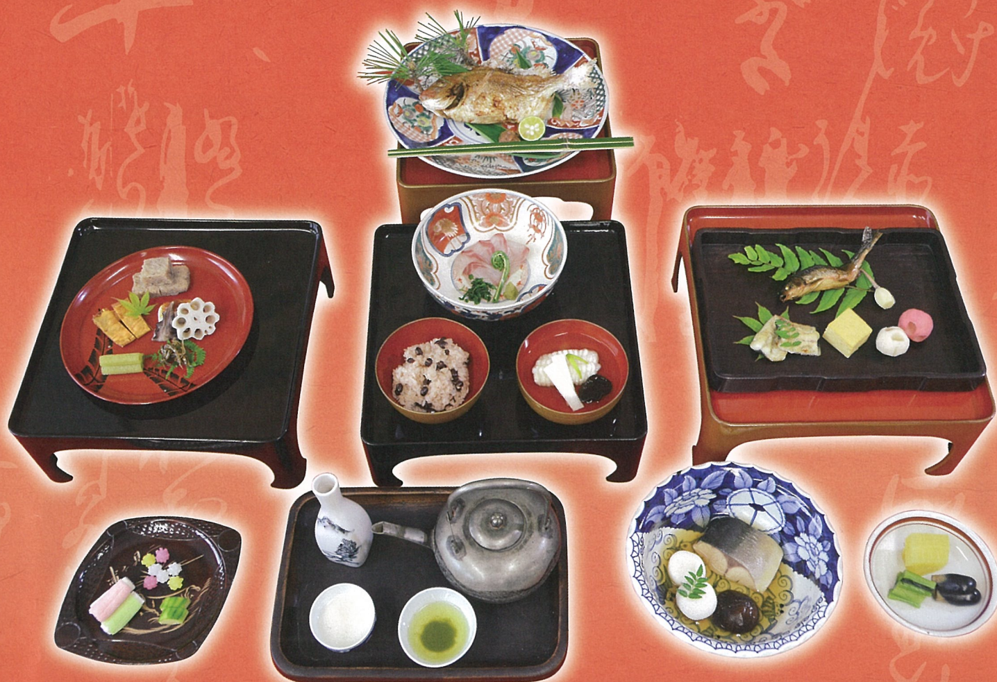
江戸時代 貞姫のおもてなし膳