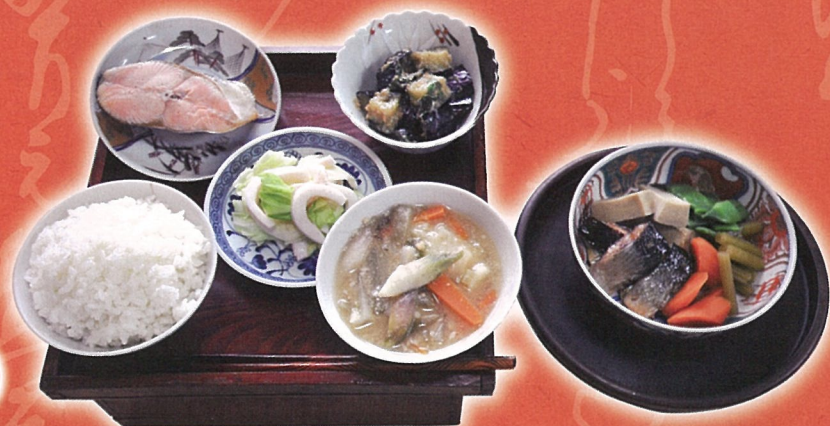
昭和30年代 ある夏の夕食

主催 安曇野市豊科郷土博物館 共催 安曇野市商工会・安曇野市商工会観光特産飲食部会