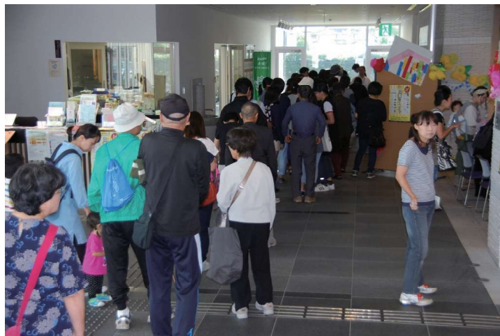
図書リサイクルコーナー