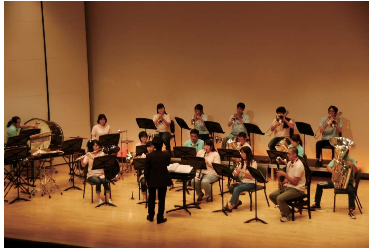
安曇野吹奏楽団コンサート