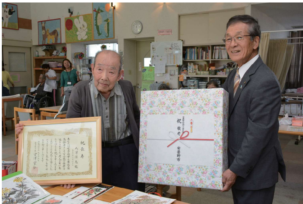
市内最高齢者市長訪問 (広報あづみの216号掲載写真)