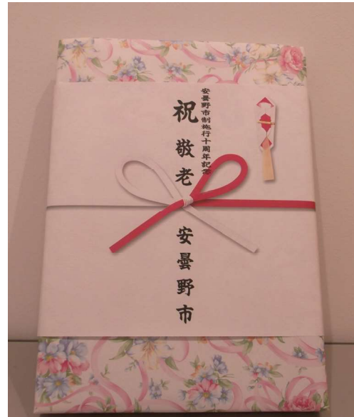
88歳（米寿）祝品及び100歳祝品