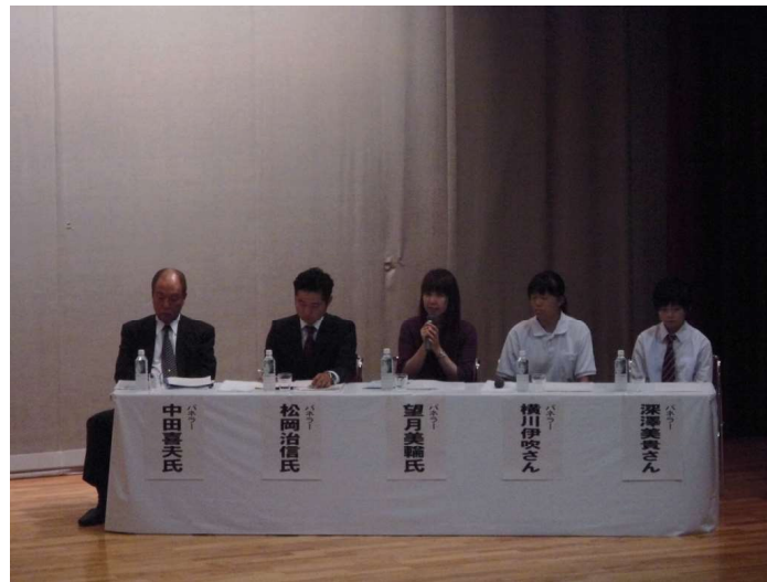
(活発なご意見をいただいたパネラーの皆さん)