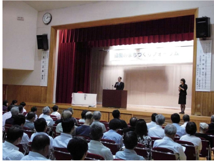
(北川氏 講演の様子)