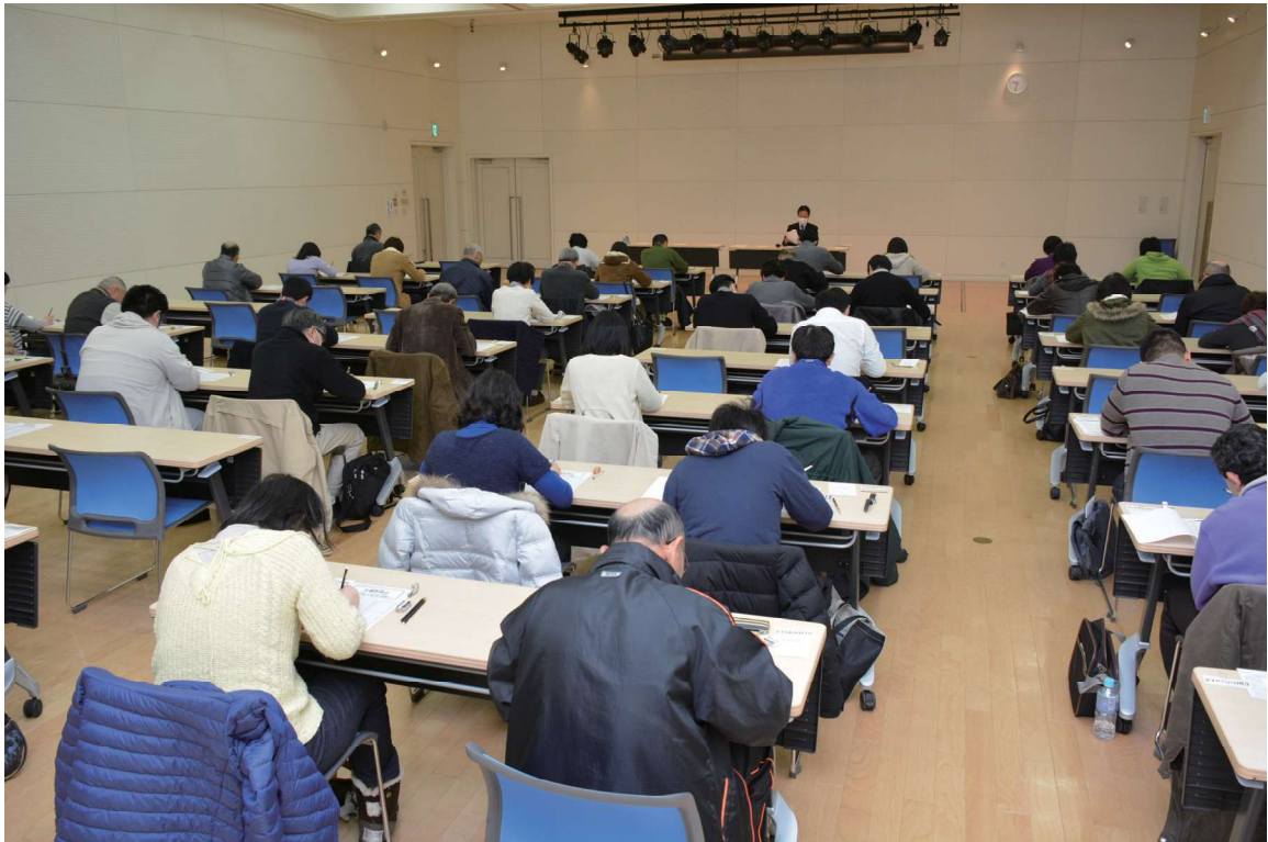
受検会場の様子（写真の会場は、豊科交流学習センター「きぼう」）