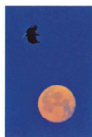
残月とオジロワシ