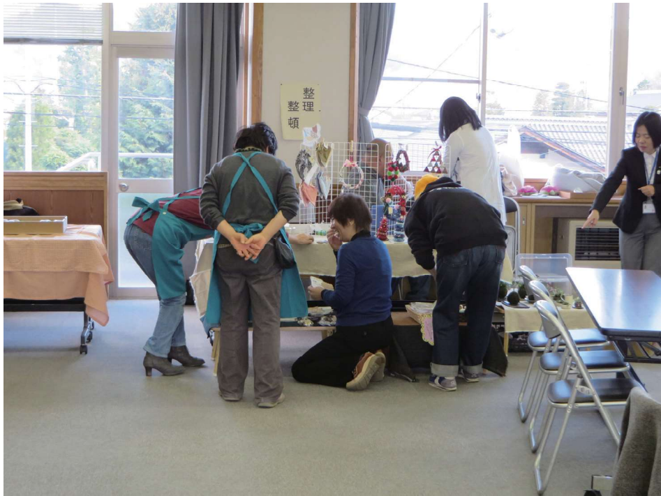
事業所の展示販売準備