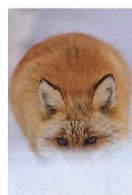
厳冬期の北ギツネ