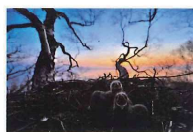
朝焼けの中のオジロワシのヒナ