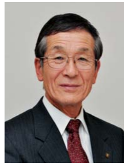
安曇野市長 宮澤 宗弘