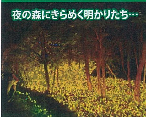
夜の森にきらめく明かりたち…