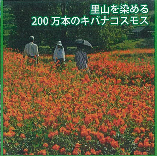
里山を染める 200万本のキバナコスモス