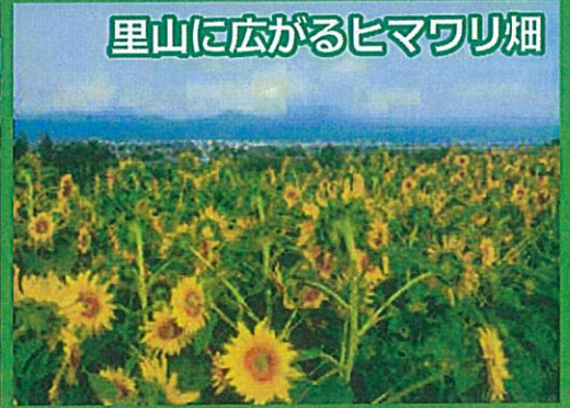
里山に広がるヒマワリ畑