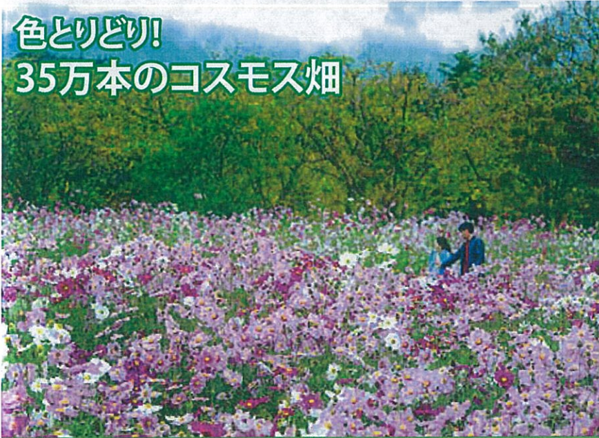
色とりどり! 35万本のコスモス畑