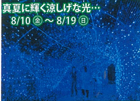
真夏に輝く涼しげな光… 8/10(金)～8/19(日)