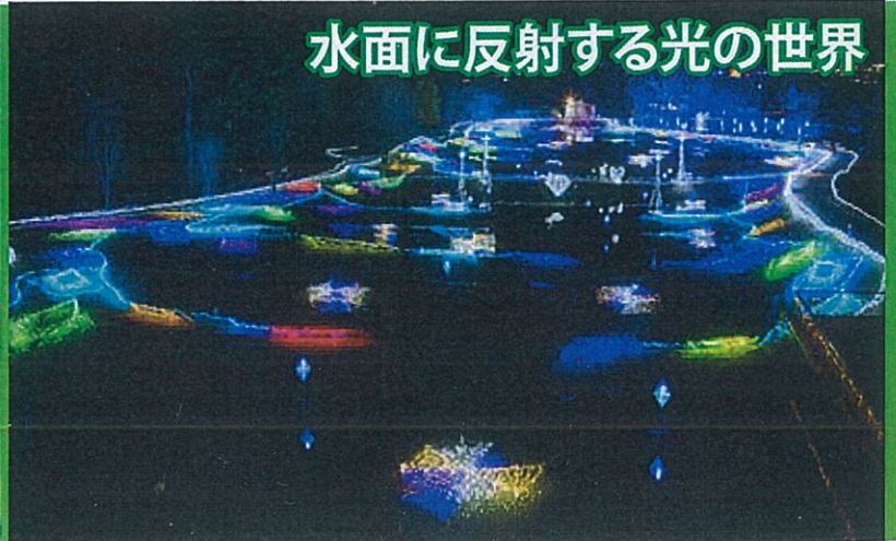
水面に反射する光の世界