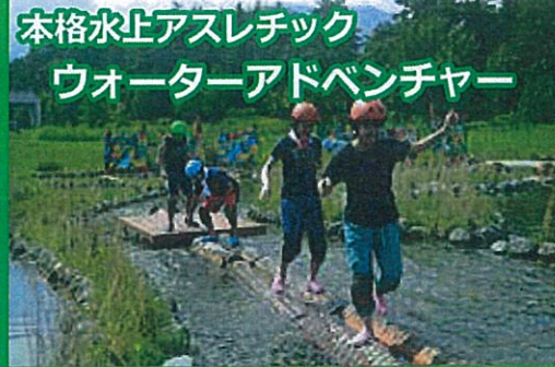
本格水上アスレチック ウォーターアドベンチャー