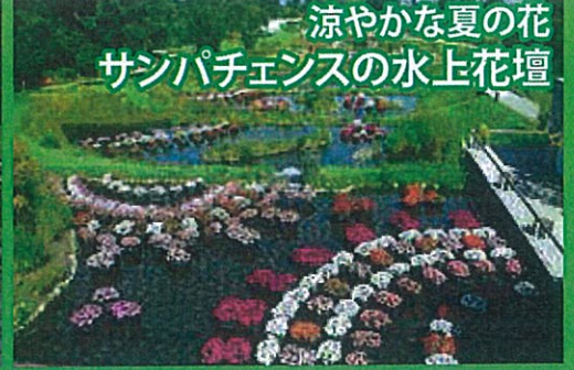
涼やかな夏の花 サンパチェンスの水上花壇