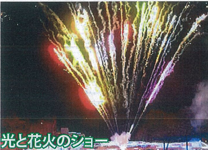
光と花火のショー