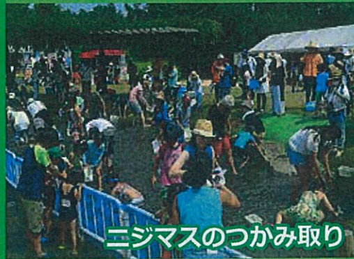
三ジマスのつかみ取り