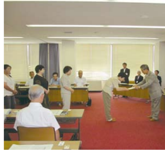
推薦委員への選任書の交付

去る7月23日、改選後初となる臨時総会が安曇野市長の招集により開催され、第四期の農業委員会の活動がスタートしました。