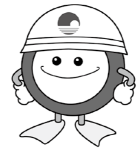
下水道マスコットキャラクター「スイスイ」